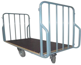
Modèle 2 dossiers & roues quinconce

G66-B-REC ( plateau bois roues en rectangle ) G66- T-LOS ( 100% tubulaire roues en losange ) LOS = roues en losange - REC = roues en rectangle