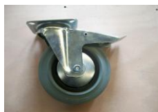
Roues avec pare-fils